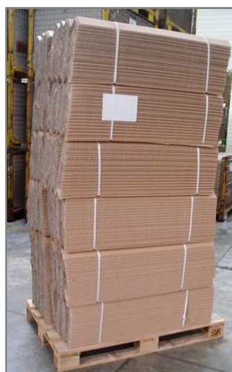
Palette 1200x800 filmée 12 paquets Hauteur 2300mm