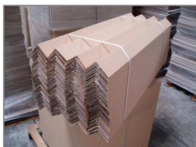
Paquet de 140 pièces