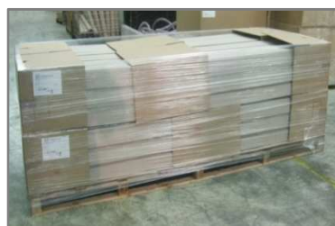
Palette 1200x3000 filmée Hauteur 1000mm Carton 600x400x300