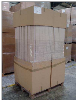
Palette 1200x1000 filmée Hauteur maxi 2400mm Carton bas 992x585x675 Carton haut 992x585x400