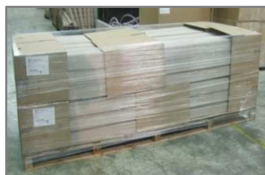
Palette 1200x3000 filmée Hauteur 1000mm Carton 600x400x300