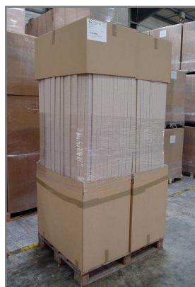
Palette 1200x1000 filmée Hauteur maxi 2400mm Carton bas 992x585x675 Carton haut 992x585x400