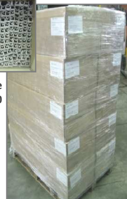
Palette 1200x800 filmée Hauteur 5 colis 1620mm