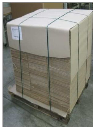
Palette 1200x1000 filmée Hauteur 1120mm