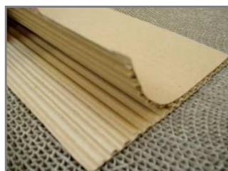
2 pièces l'une dans l'autre