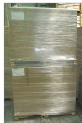
Palettes 1200X1000 filmées Hauteur 2220mm