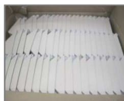
Caisse carton 1185x985x985mm