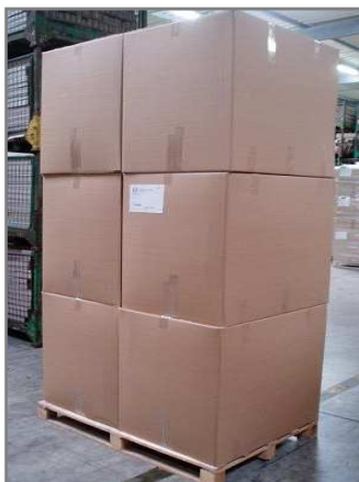
6 caisses 800x600x760mm Palette 1200x800mm filmée Hauteur 2400mm