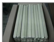
Caisse carton 996x596x510mm