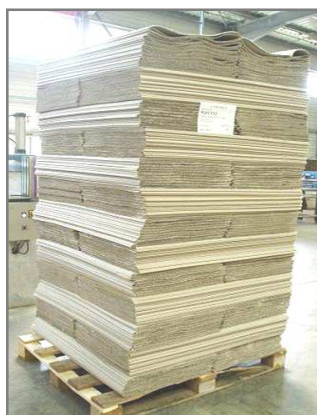
Palette 1200x1000 filmée Hauteur maxi 2400mm