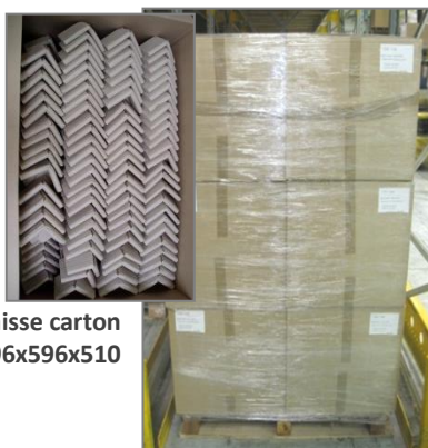
Caisse carton 996x596x510

Palette 1200x1000 filmée Hauteur 3 colis 1670mm Hauteur 4 colis 2180mm