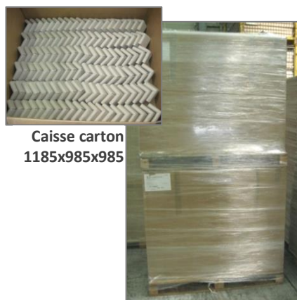
Caisse carton 1185x985x985

Palette 1200x1000 filmée Hauteur 3 colis 1670mm Hauteur 4 colis 2180mm