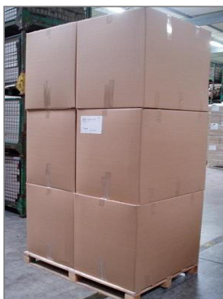
6 caisses 800x600x760mm Palette 1200x800mm filmée Hauteur 2400mm