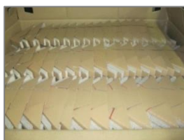
Caisse carton 1185x985x985mm