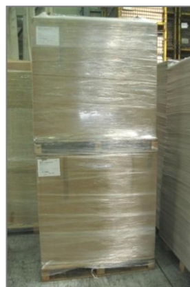
Palettes 1200x1000 filmées