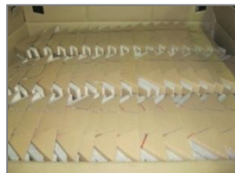
Caisse carton 1185x985x985mm