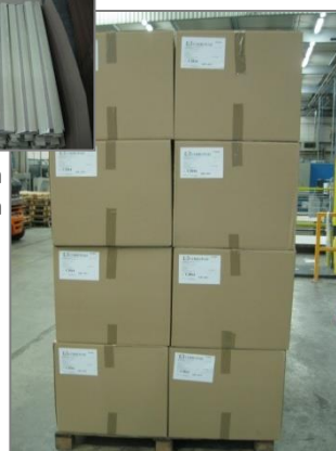
Palette 1200x1000 filmée Hauteur 2280mm