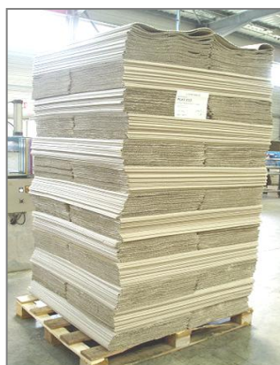
Palette 1200x1000 filmée Hauteur maxi 2400mm