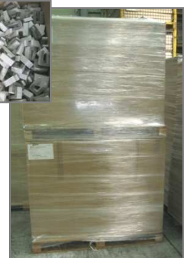
Palette 1200x1000 filmée Hauteur 2260mm