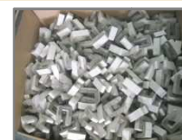
Caisse carton 1185x985x985