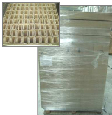
Palette 1200x1000 filmée