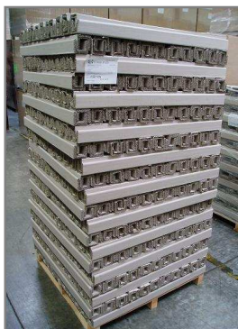
Palette 1200x1200 filmée Hauteur maxi 2400mm