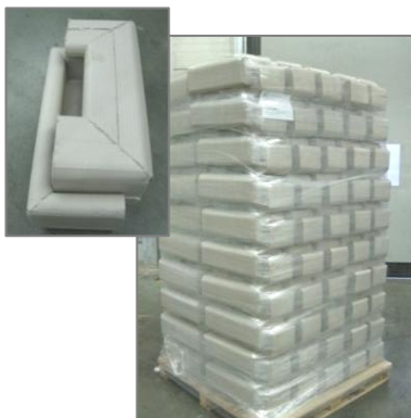
Palette filmée Hauteur maxi 2400mm