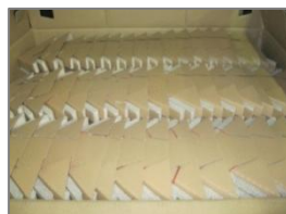
Caisse carton 1185x985x985mm